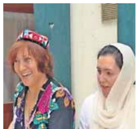
Auf Augenhöhe: Gäste und Gastgeber haben Spaß miteinander.

„Die vielen Spenden verderben die Leute, sodass sie nie mehr auf eigenen Füßen stehen können“, davon ist er überzeugt. Die Flüchtlinge haben zwar viele Entbehrungen erdulden müssen und Leid, aber wegen der Schlepper sind sie mit der Vorstellung nach Deutschland gekommen, dass hier das Geld auf der Straße liege. Die meisten sind einfache Tagelöhner, die die Geschichten der Schlepper glaubten und